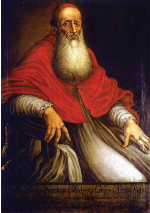
Prymas Stanisław Karnkowski. Portret w muzeum archikatedralnym w Gnieźnie.

Żył w czasach wprowadzania na terenie Rzeczypospolitej postanowień soboru w Trydencie. Stało się to jednym z najważniejszych zadań, jakie podejmował, kierując diecezją włocławską, a następnie przewodnicząc Kościołowi. Doskonale rozumiał, iż odnowa katolicyzmu zależy od sprawności prowadzenia reewangelizacji po rozpowszechnieniu się myśli i tezy Marcina Lutra w Europie. Rządy w diecezji rozpoczęły od zwołania synodu i wizytacji parafii, czego wynikiem było m.in. erygowanie 16 sierpnia 1569 r. pierwszego w Królestwie Polskim Wyższego Seminarium Duchownego we Włocławku 1 .