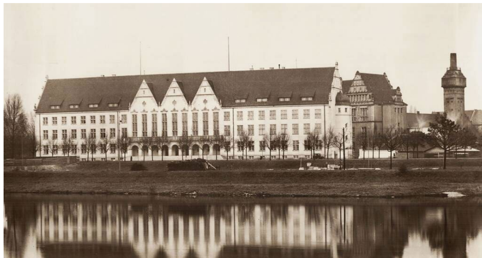
Ilustracja 4. Gmach główny Wyższej Szkoły Technicznej