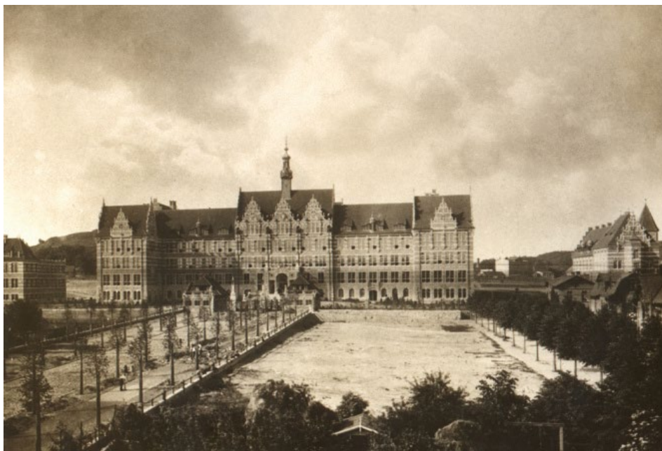
Ilustracja 3. Gmach główny Politechniki Gdańskiej