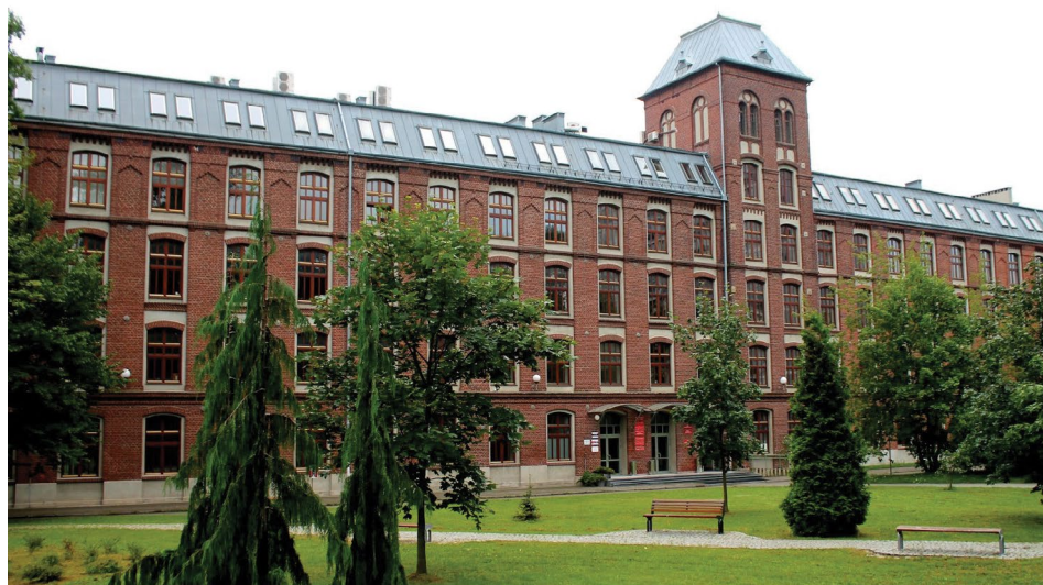
Ilustracja 2. Gmach główny Politechniki Łódzkiej