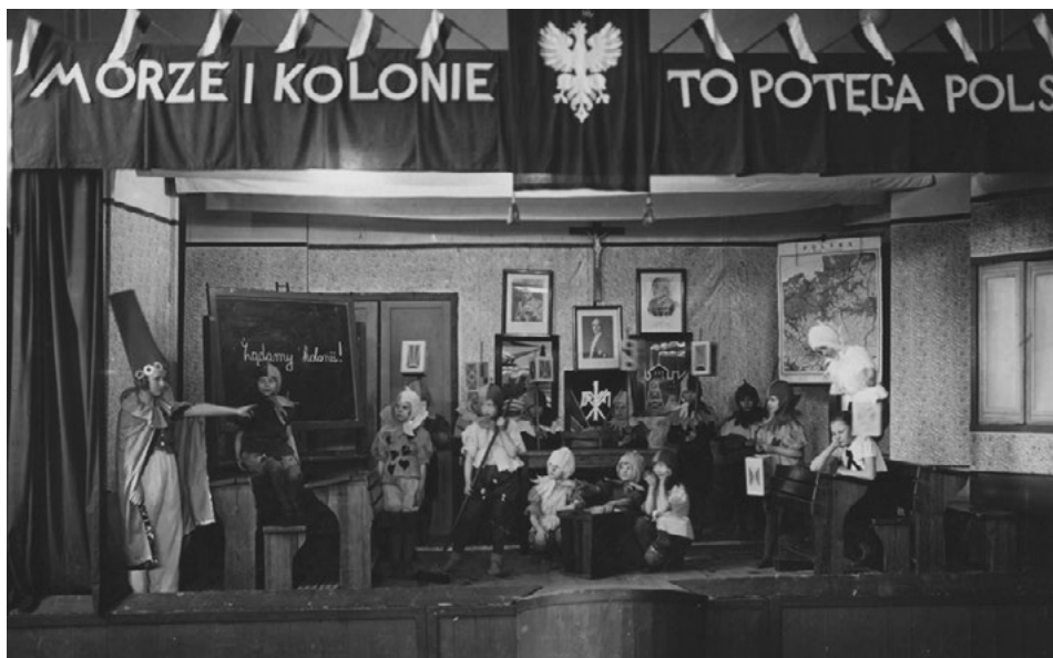
Fot nr 1. Widowisko teatralne w Szkole Powszechnej w Łaziskach (województwo śląskie, powiat Pszczyzna) poruszające tematykę marynistyczną i propagujące ideę dostępu Polski do kolonii. Nad sceną widnieje hasło: „Morze i kolonie to potęga Polski”. Fotografia została wykonana w 1939 r.

Podsumowując tą sferę zaangażowania kół i szkół w obchody rocznicy odzyskania dostępu do morza za lata 1935–1936, Zarząd Główny LMiK stwierdzał: „W szkołach, jak również w poszczególnych organizacjach młodzieży urządzono specjalne akademie i zebrania poświęcone sprawie morza. Na ten cel przeznaczono również w szkołach jedną godzinę wykładów” 85 .