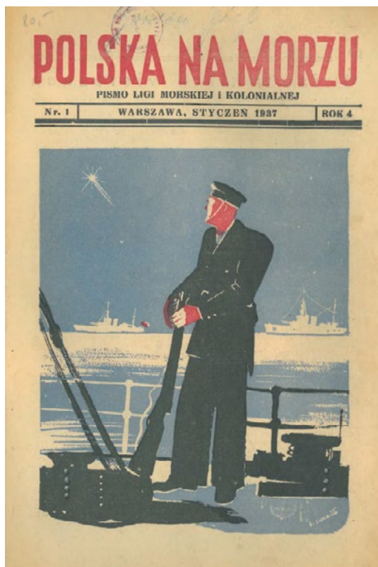
Il. nr 3. Strona tytułowa czasopisma „Polska na Morzu. Pismo Ligi Morskiej i Kolonialnej” nr 1 z 1937 r.

żeglarski LMiK na jeziorach Świtez lub nad Narocz. Natomiast koła z miejscowości połączonych wspólną siecią szlaków wodnych (Wieprz, Bug, Wisła) miały uczestniczyć w spływach regionalnych, organizowanych przez Sekcję Sportów Wodnych Okręgu w czerwcu 1937 r. Ponadto powinny one czynić przygotowania do udziału młodzieży w planowanej również w czerwiec wycieczce szkolnej statkiem „Wisła” do Gdyni. Z kolei koła działające na terenie szkół w miejscowościach pozbawionych wody miały zwrócić uwagę na korespondencję z młodzieżą polską poza granicami kraju. Ostatnia wytyczna dotyczyła przeprowadzenia w szkołach cyklu pogadanek dotyczących spraw morskich i kolonialnych 146 .