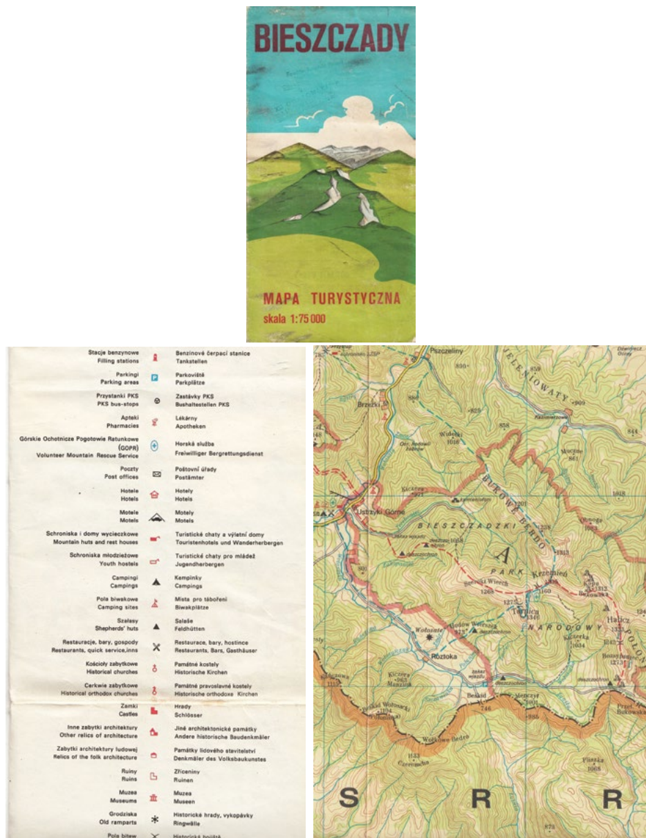
Ryc. 2. Okładka, legenda i fragment mapy turystycznej Bieszczadów PPWK z 1979 r.

Ostrowski w 1975 r. zwrócił uwagę na poprawę jakości map z tego okresu, podkreślając systematyczny postęp w zakresie bogactwa i poprawności treści oraz czytelności znaków kartograficznych 19 .