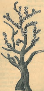
KORALE. (Str. 449.)

Pracownicy moguncy, roznieśli po całej Europie swój nieoceniony przemysł. Od roku 1467 do 1491 sztuka drukarska uczyniła olbrzymie postępy, uczniowie Guttenberga nabyli sławy, a w dziesięć lat później, we Włoszech, już ukazywały się edycje wspaniałe