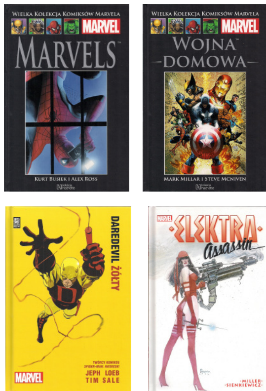
Rys. 2. Przykładowe okładki komiksów Marvel Comics wydanych przez Hachette Polska, Mucha Comics i Egmont Publishing