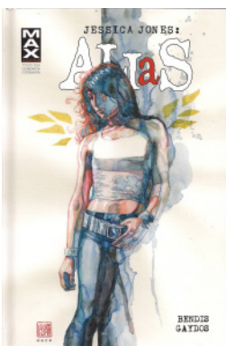
Rys. 1. Przykładowe okładki komiksów Marvel Comics wydanych przez Egmont Publishing i Mucha Comics