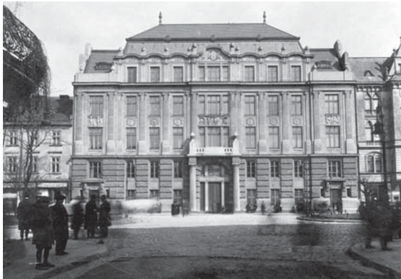
Ilustracja 1. Gmach główny lwowskiej Izby Handlowej i Przemysłowej przy ulicy Akademickiej (1926 rok)