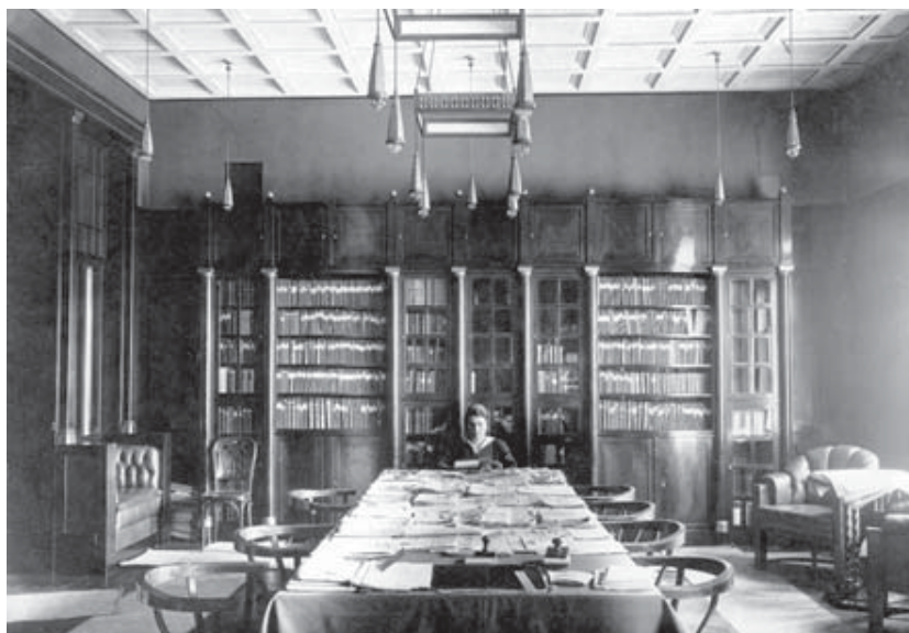
Ilustracja 2. Biblioteka w siedzibie lwowskiej Izby Handlowej i Przemysłowej przy ulicach Akademickiej i Boularda (1926 rok)